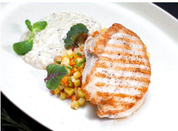
Индейка с овощным рататутем, яблоком и сливочным соусом