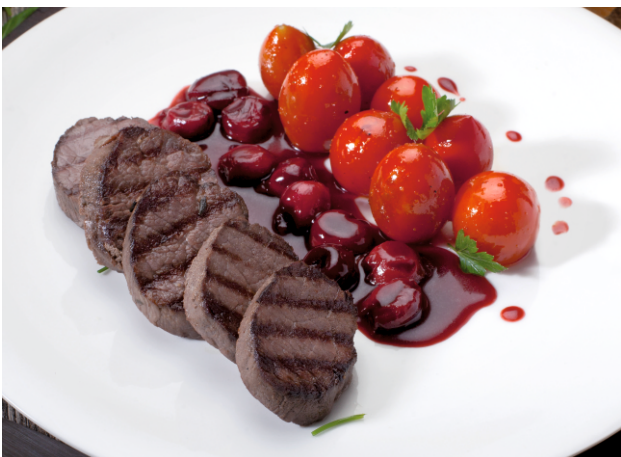
РОСТБИФ с томатами в карамели и розмарином 560.- 250 г