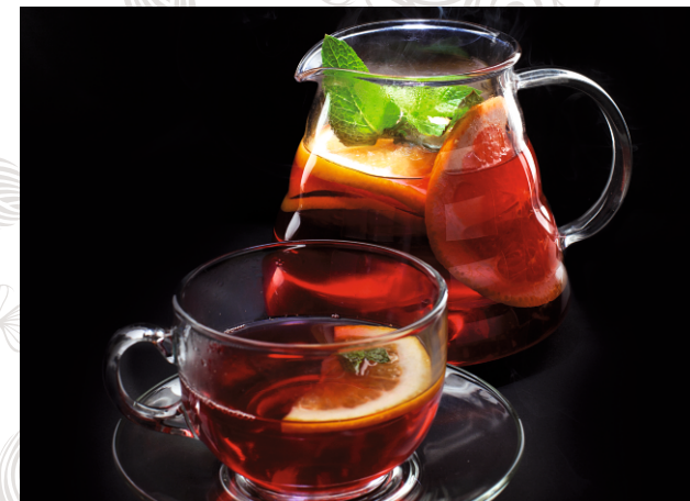
ЧАЙ С ГРЕЙПФРУТОМ, АПЕЛЬСИНОМ И МЯТОЙ