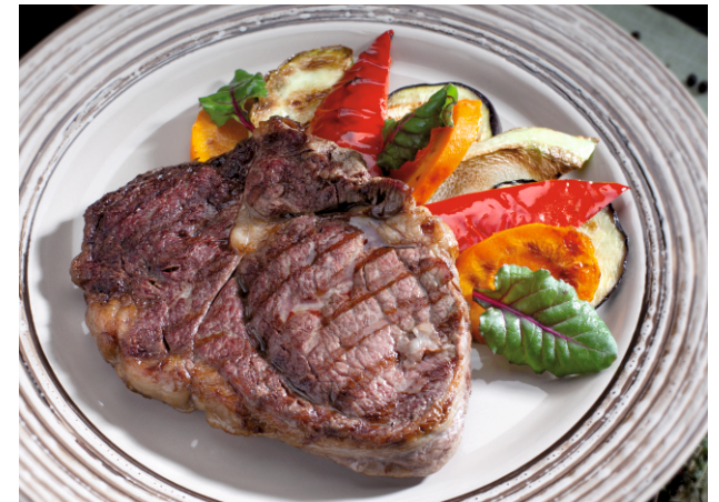
СТЕЙК РИБАЙ 650.- с овощами гриль 230 г