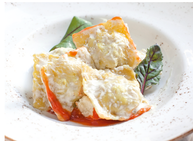
РАВИОЛИ С ГОВЯДИНОЙ В СОУСЕ БЕШАМЕЛЬ