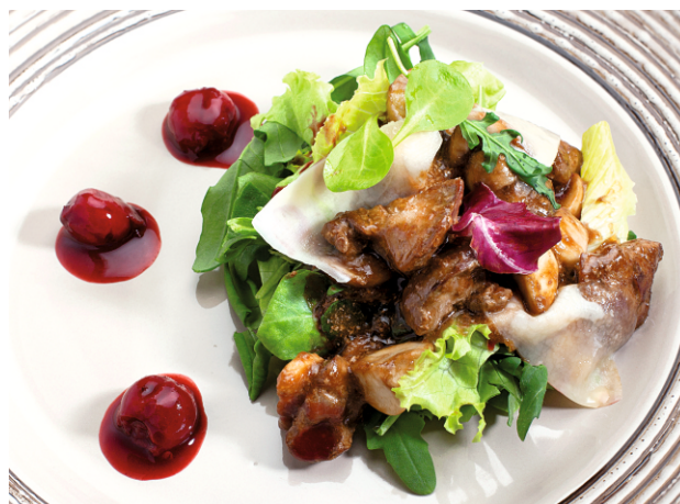
САЛАТ с куриной печенью и вишневым бальзамиком