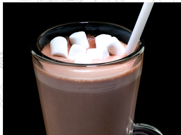
КАКАО/150 мл КАКАО с маршмеллоу/160 мл КАКАО Крош/350 мл