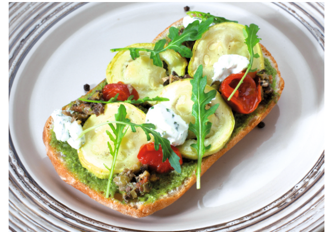
БРУСКЕТТА с ПЕЧеныМИ ОВОЩАМИ и СЫРНЫМ ПРЯНЫМ КРЕМОМ