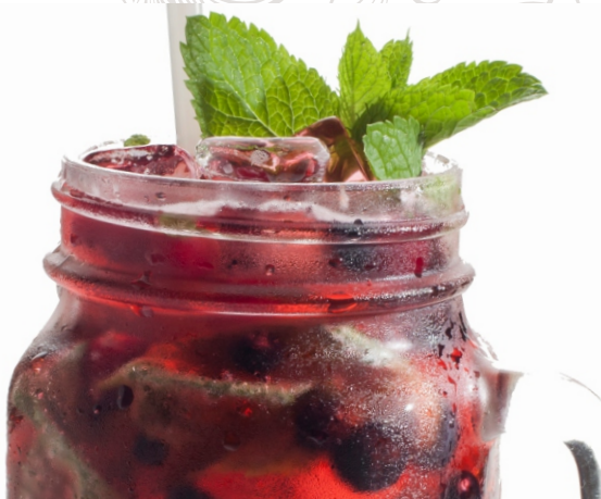
Лимонад мятная клюква 250.- 400 мл