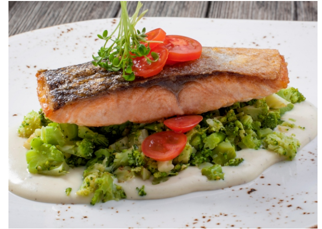
СЕМГА НА ГРИЛЕ с брокколи и соусом бешамель 650.- 230 г