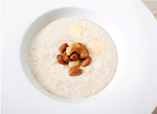
Каша овсяная с орехами