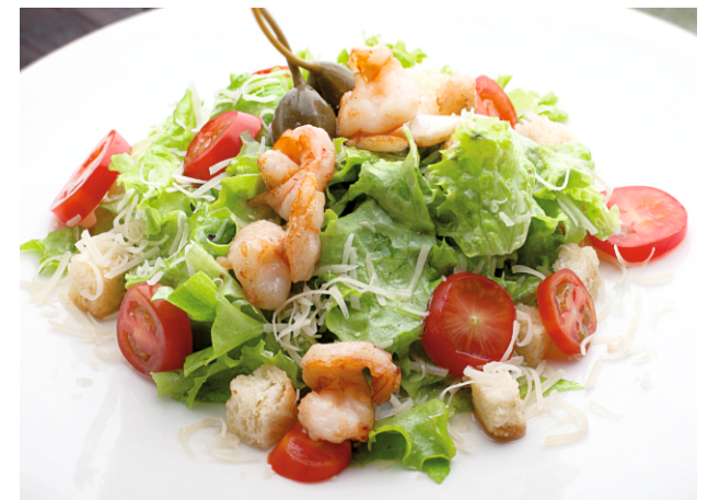
САЛАТ ЦЕЗАРЬ с КРЕВЕТКОЙ