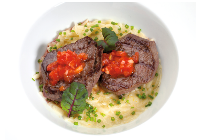
МЕДАЛЬОНЫ ИЗ ГОВЯДИНЫ 480.- в сливочном орзо 250 г