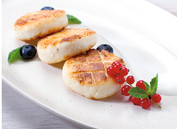
Сырники со сметаной