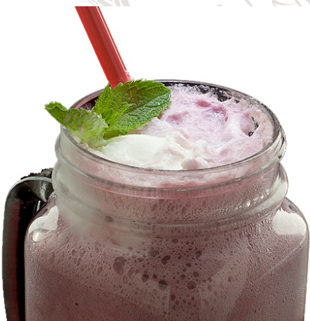
Коктейль «ПРИВОРОТНОЕ ЗЕЛЬЕ»