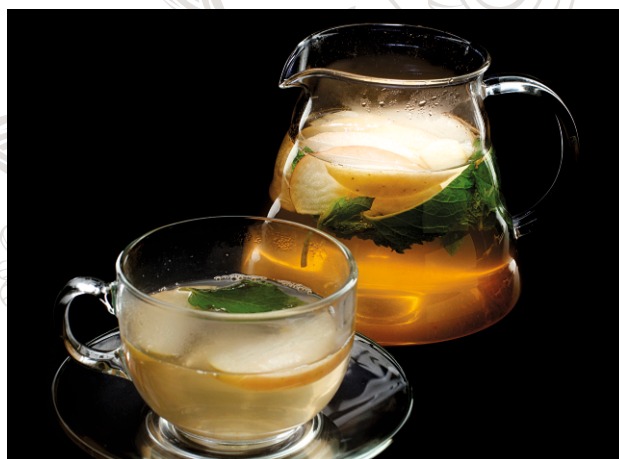
ЧАЙ С ЯБЛОКОМ И МЯТОЙ