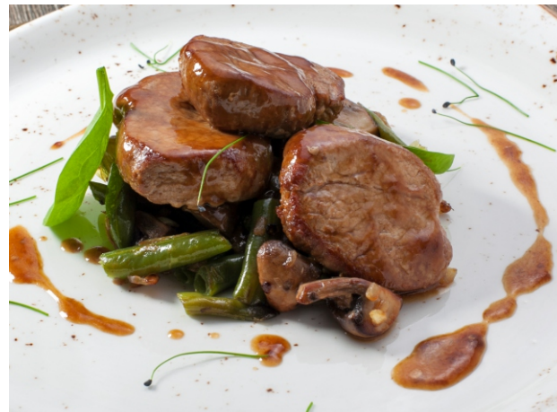
Медальоны из свинины со стручковой фасолью и грибами