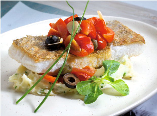
ПАЛТУС с пюре из сельдерея и овощным рататюем 540.- 260 г