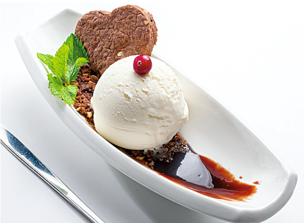
МОРОЖЕНОЕ ПЕСОЧНЫЕ ЗАМКИ