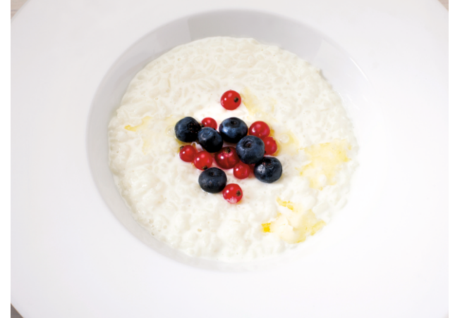
Каша рисовая с ягодами