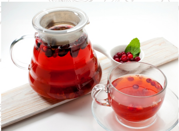
ЧАЙ С ШИПОВНИКОМ И ЛЕМОНГРАССОМ