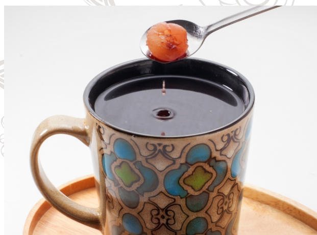
ГЛИНТВЕЙН с виноградом и черносливом