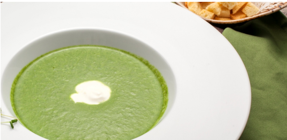
Суп-пюре из шпината с пармезаном 290.-