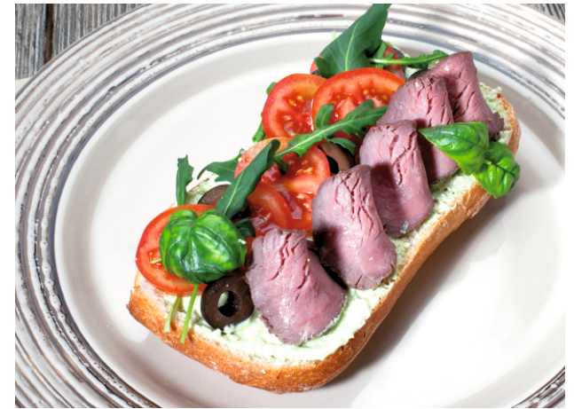
БРУСКЕТТА с РОСТБИФОМ и КРЕМОМ ФИЛАДЕЛЬФИЯ