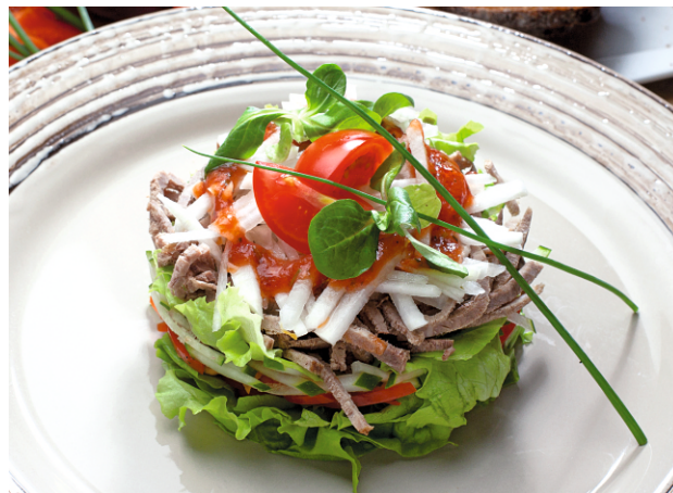
САЛАТ Мадрид с говядиной