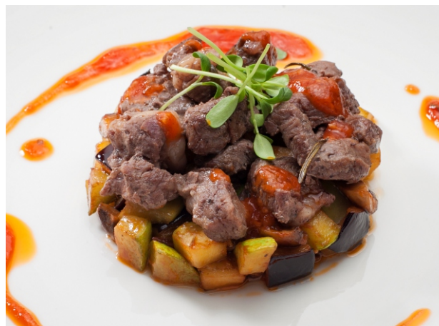
ЗАПЕЧЕННАЯ ГОВЯДИНА 470.- с овощным рататюем 220 г