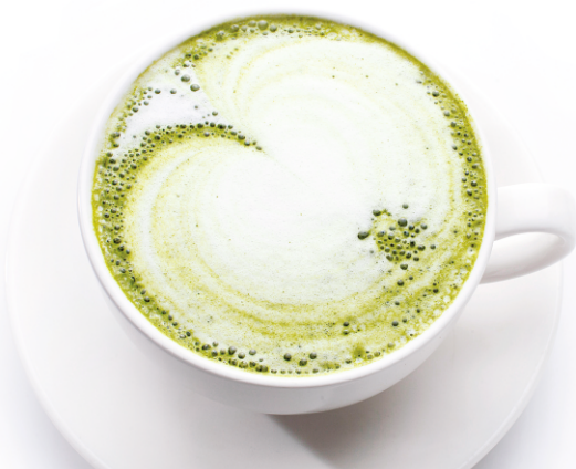
ЧАЙ МАТЧА ЛАТТЕ на соевом или обезжиренном молоке