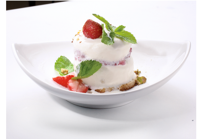
МОРОЖЕНОЕ КЛУБНИЧНЫЙ ДЕБЮТ