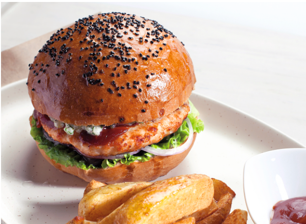
ЛАВИТА БУРГЕР с КУРИЦЕЙ