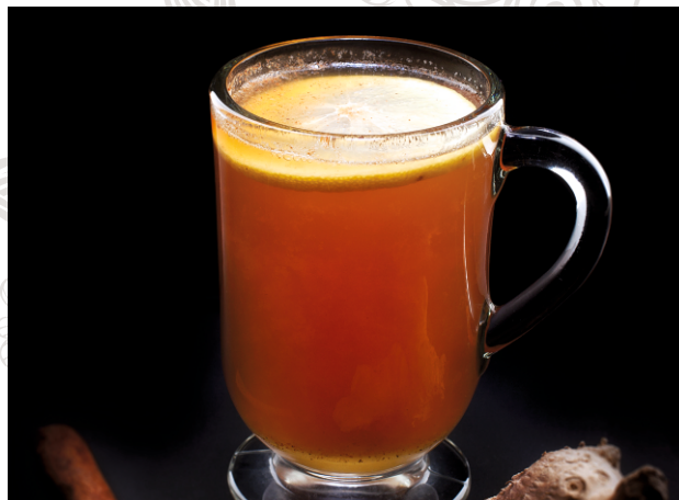
ИМБИРНЫЙ ЧАЙ С ЛИМОНОМ И МЕДОМ