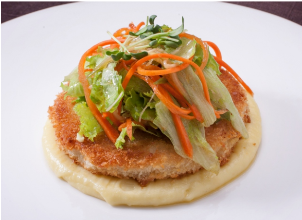
КОТЛЕТА ИЗ ЩУКИ И ПАЛТУСА 420.- с картофельным пюре 250 г