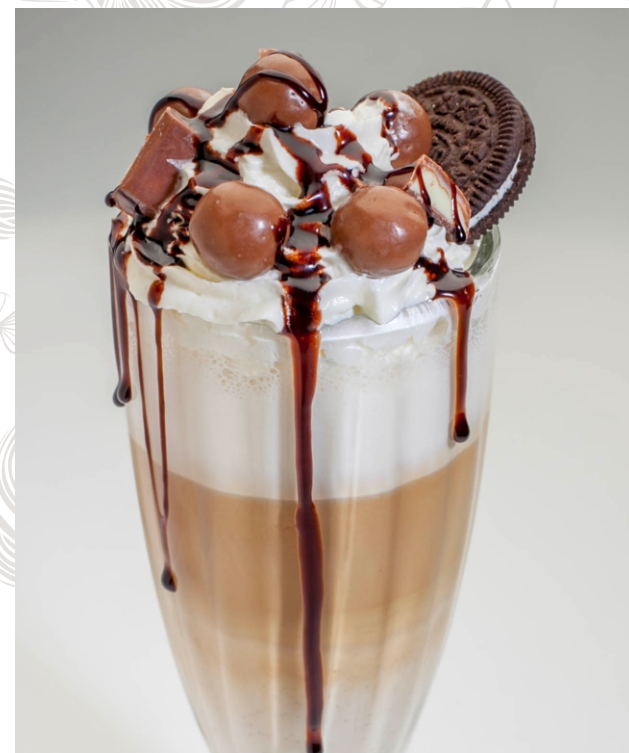
ЛАТТЕ ШОКОЛАДНЫЙ ПРЯНИК