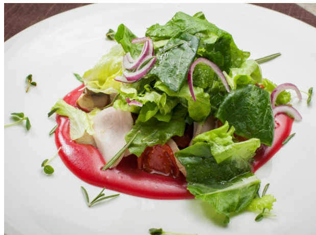
САЛАТ с бужениной, грибами и помидорами конкасе и брусничным соусом