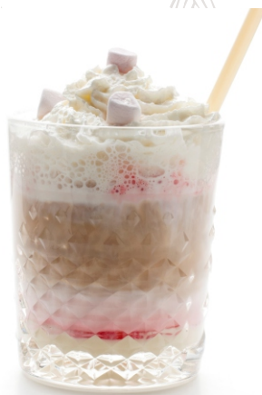
ТАЙ-ЛАТТЕ с сиропом Бобы Тонка и Гренадином