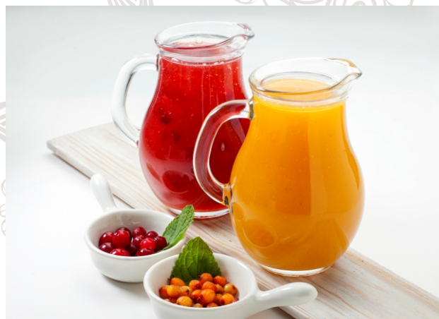
КИСЕЛЬ КЛЮКВЕННЫЙ или ОБЛЕПИХОВЫЙ