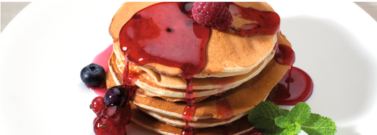
Панкейки с ягодным соусом