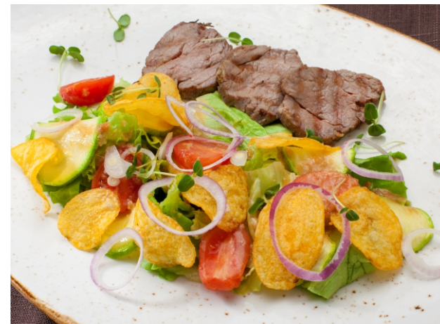
САЛАТ с ростбифом, пряным соусом и бальзамическим кремом