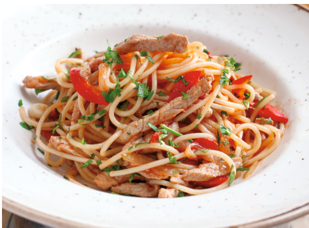
СПАГЕТТИ СО СВИНИНОЙ И СОУСОМ ЧИЛИ