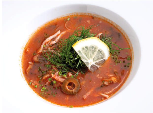
Солянка сборная 280.-