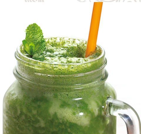
СМУЗИ со шпинатом, апельсином и бананом