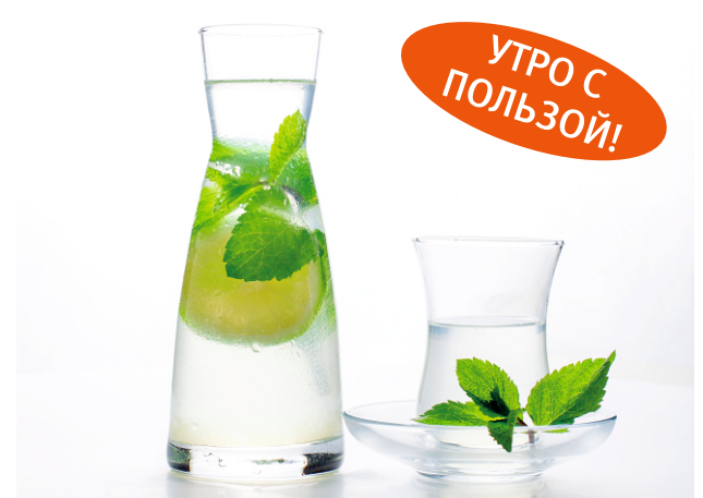
Сасси с лаймом и мятой