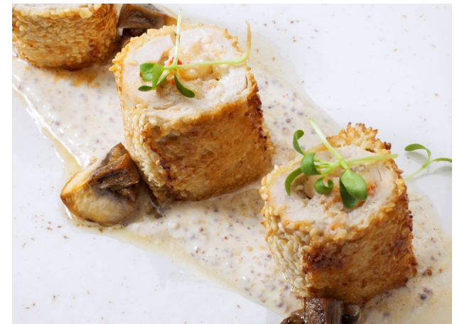
Рулетки из индейки с креветкой