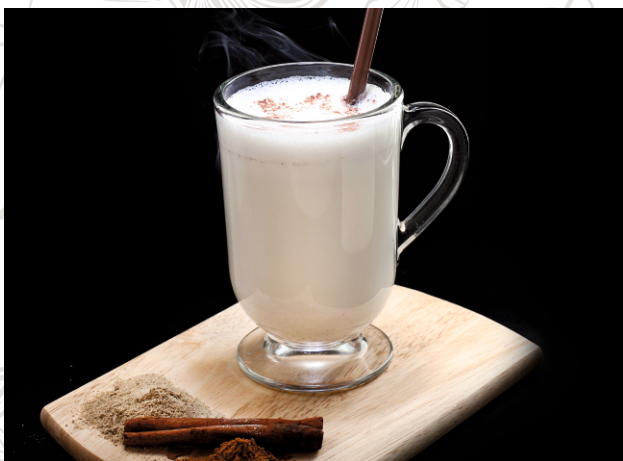
ГОРЯЧЕЕ МОЛОКО с медом и пряностями