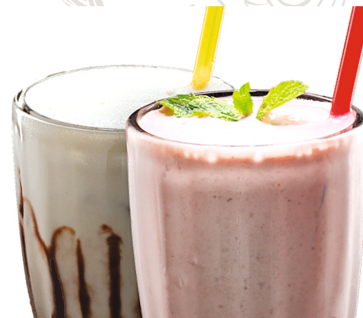
Милкшейки: черника, банан, ананас, шоколад, клубника+мята 250.- 280 мл