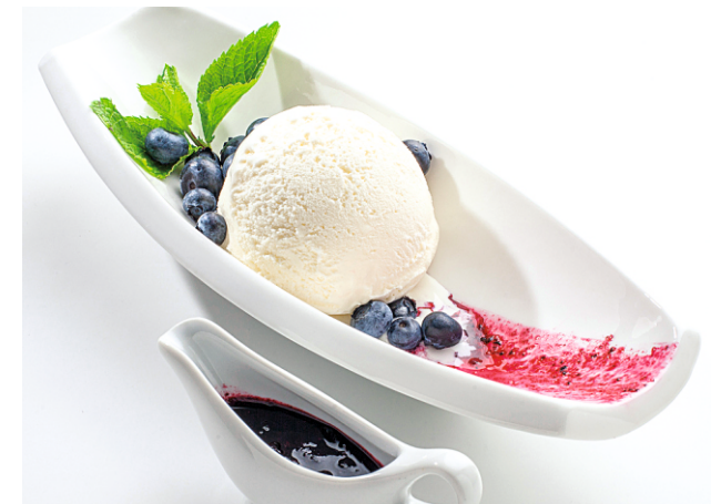
МОРОЖЕНОЕ ЧЕРНИКА С МЯТОЙ