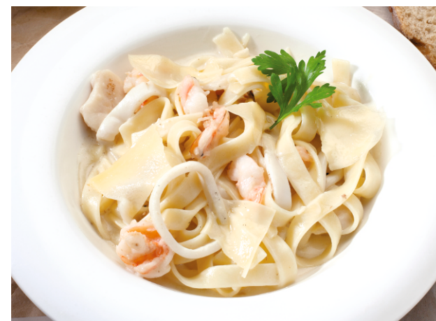
ТАЛЬЯТЕЛЛЕ С МОРЕПРОДУКТАМИ В СЛИВОЧНОМ СОУСЕ