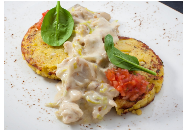
Фрикасе из индейки с белыми грибами и картофельным драником