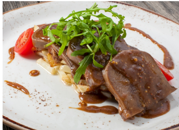
Язык с жареным сельдереем в горчичном соусе