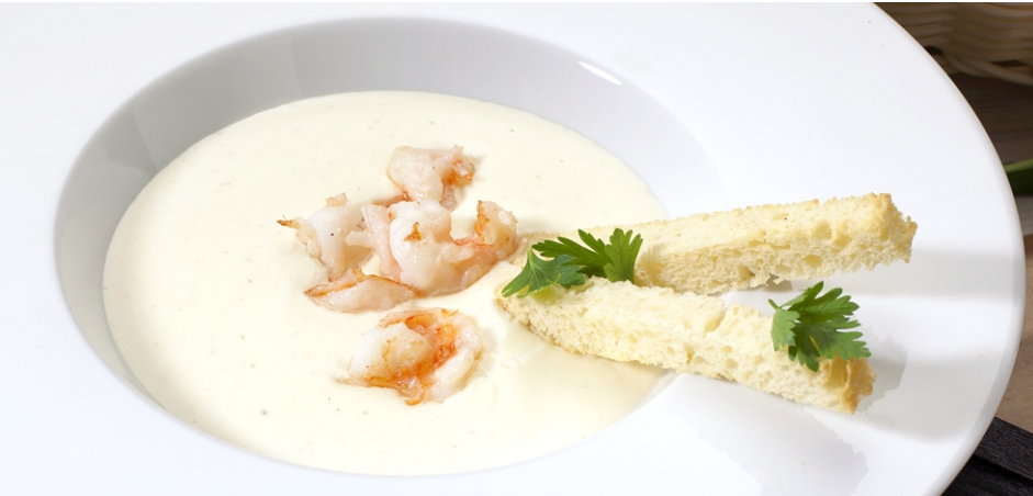
Крем-суп сырный с креветкой 350.-