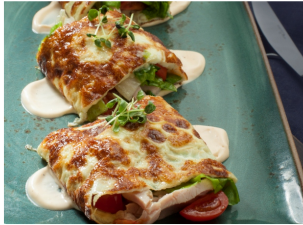
Омлет с бужениной и овощным миксом