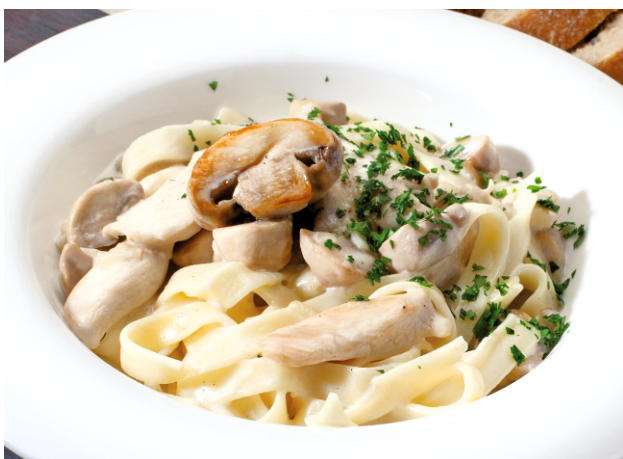
ФЕТУЧИНИ С ИНДЕЙКОЙ И ШАМПИньОНАМИ