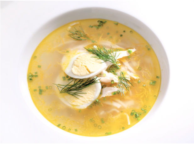
Бульон с домашней лапшой, курицей и яйцом 180.- 300 г