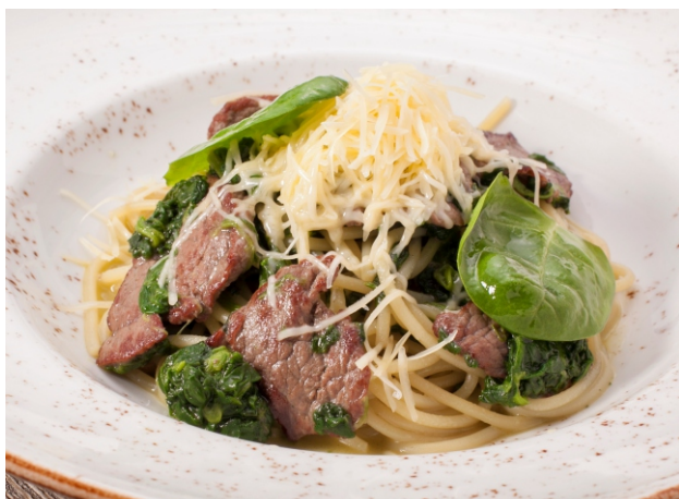
СПАГЕТТИ С ГОВЯДИНОЙ И ШПИНАТОМ