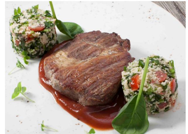
Свинина гриль с табуле