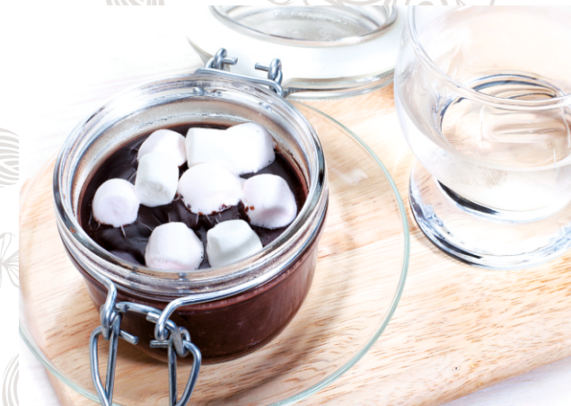
ГОРЯЧИЙ ШОКОЛАД с маршмеллоу и соленой карамелью