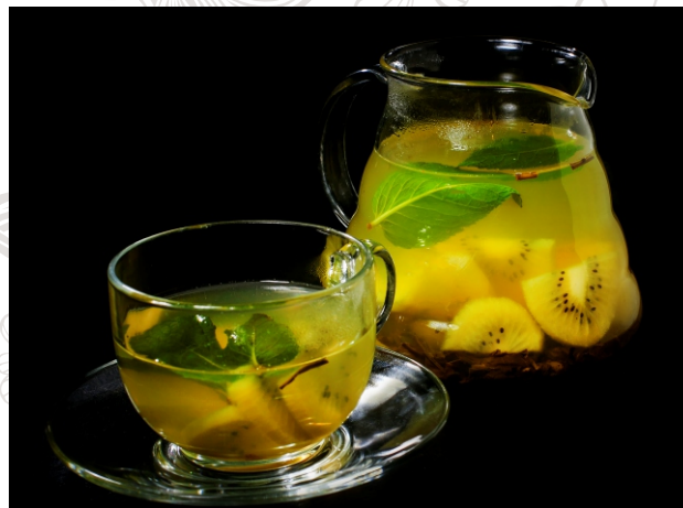
ЧАЙ С КИВИ И ЖАСМИНОМ