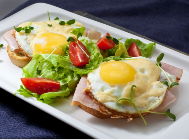
Глазунья с ветчиной и сыром на тостах