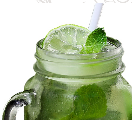
МОХИТО с лаймом и мятой