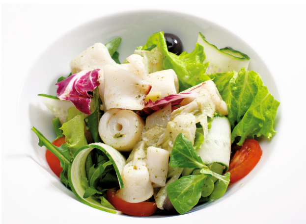
ТЕПЛЫЙ САЛАТ с КАЛЬМАРОМ под соусом ПЕСТО