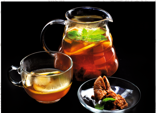
ЧАЙ С ИМБИРЕМ И ИНЖИРОМ