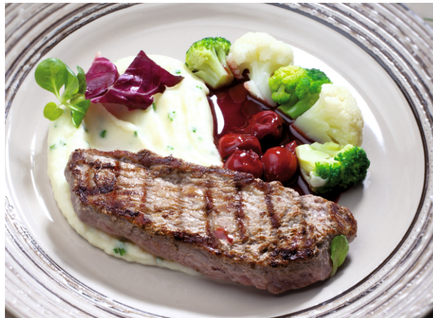
ЧАК РОЛЛ 560.- и вишневым соусом 270 г