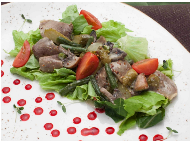
САЛАТ с теплым языком, овощами и заправкой Дижон