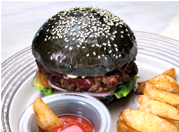
ЛАВИТА БУРГЕР с говядиной