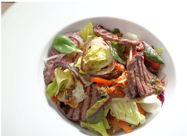
САЛАТ с говядиной гриль и имбирным соусом