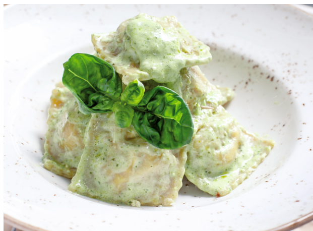
РАВИОЛИ С ГРИБАМИ И КАПУСТОЙ В СОУСЕ ПЕСТО