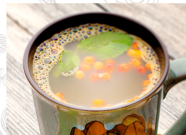
СБИТЕНЬ с облепихой и зверобоем