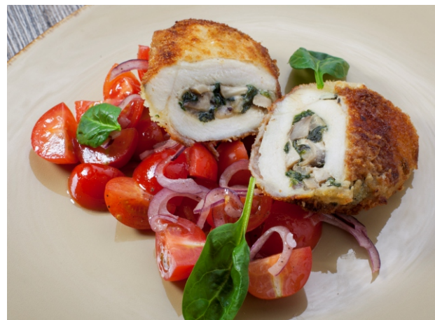
Куриная грудка с грибами, шпинатом и томатами