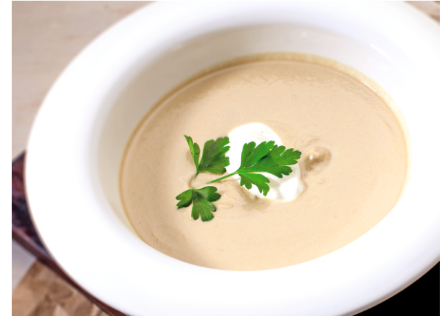
Крем-суп грибной 280.- 315 г 250 г