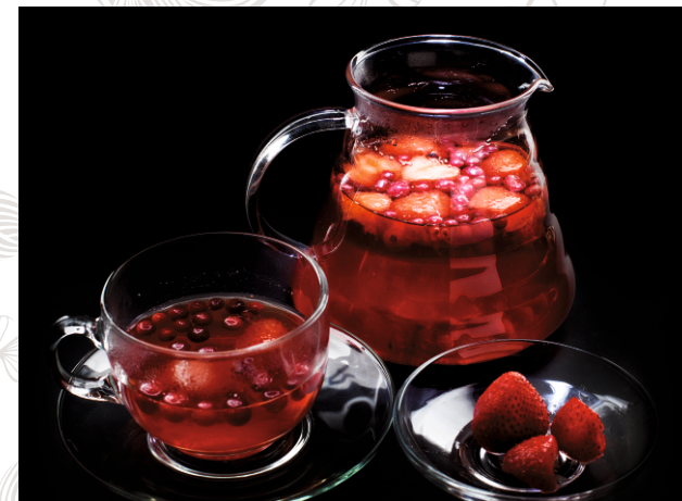
ЧАЙ БРУСНИЧНЫЙ С КЛУБНИКОЙ