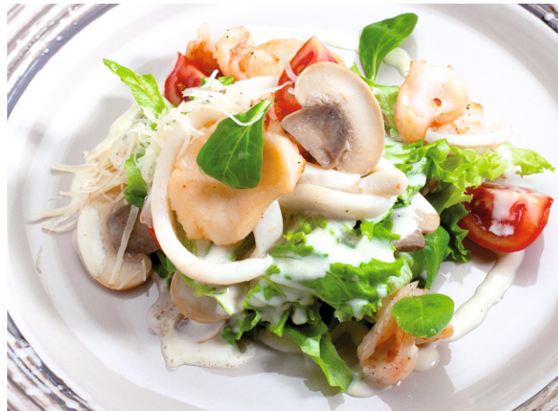
ТЕПЛЫЙ САЛАТ с МОРЕПРОДУКТАМИ