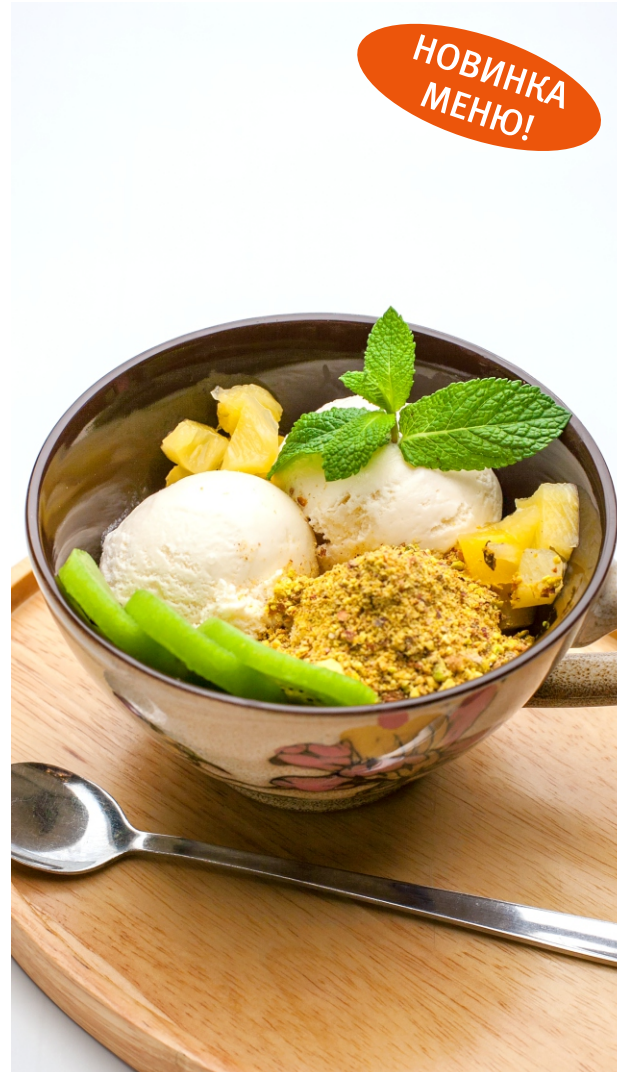
МОРОЖЕНОЕ ФРУКТОВОЕ С ФИСТАШКАМИ