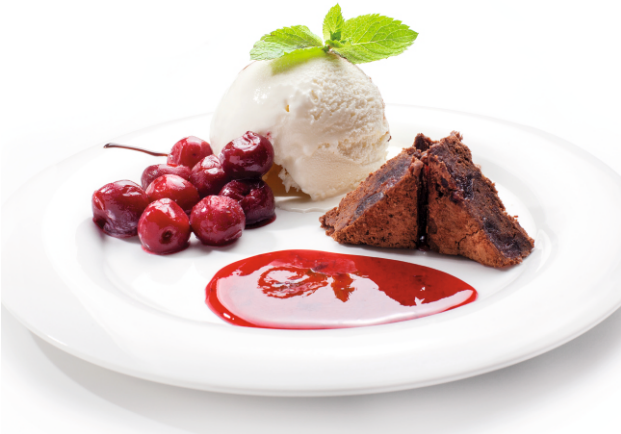
МОРОЖЕНОЕ ВИШНЕВЫЙ БРАУНИ