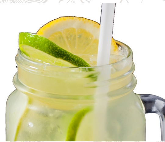
250.- Лимонад с лаймом и лемонграссом 250.- 400 мл