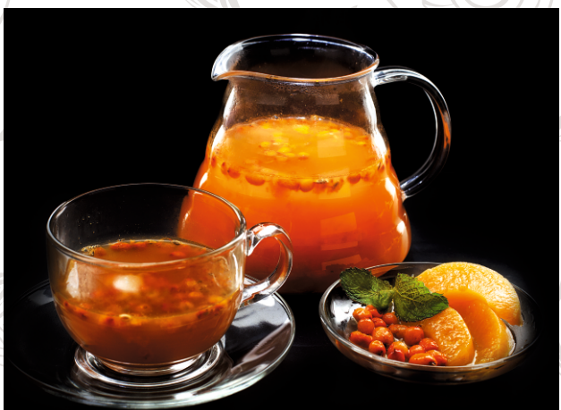
ЧАЙ С ОБЛЕПИХОЙ И ПЕРСИКОМ