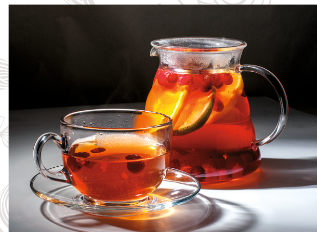
ЧАЙ С КЛЮКВОЙ АПЕЛЬСИНОМ И ЛАЙМОМ