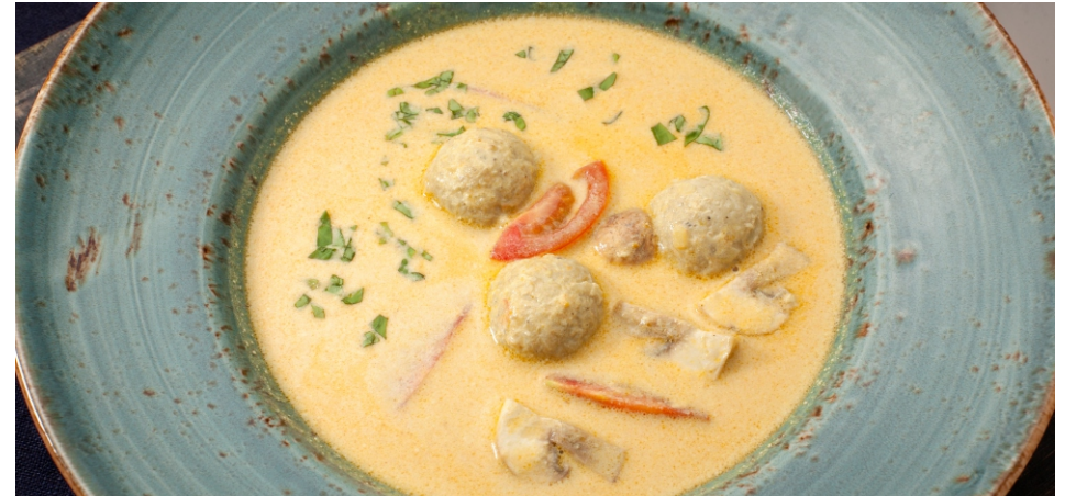
Суп Биск на креветочном бульоне с куриными фрикадельками 270.- 245 г 260 г