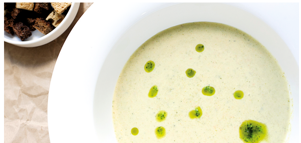
Крем-суп из брокколи с крутонами 210.- 220 г 300 г