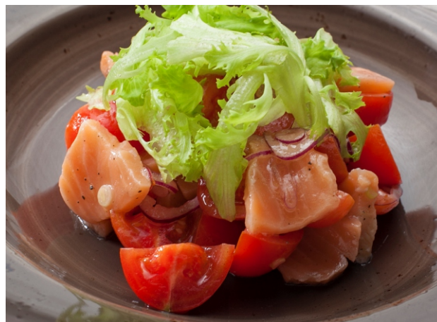
АМУРСКИЙ САЛАТ с СЕМГОЙ