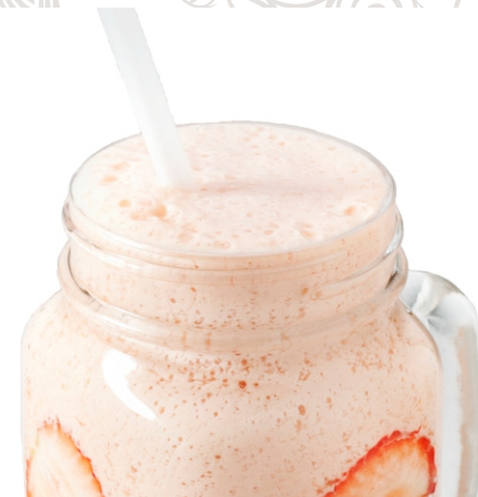
СМУЗИ с апельсином и клубникой