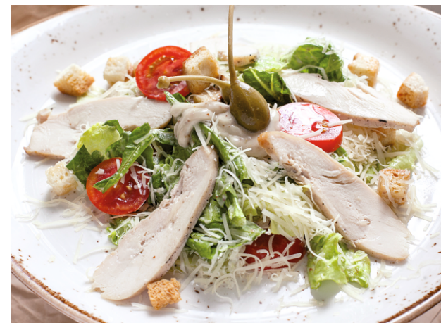
САЛАТ ЦЕЗАРЬ с курицей или индейкой