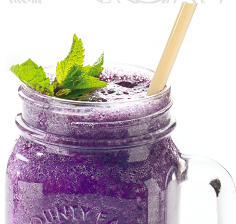
СМУЗИ с черникой и бананом на соевом молоке