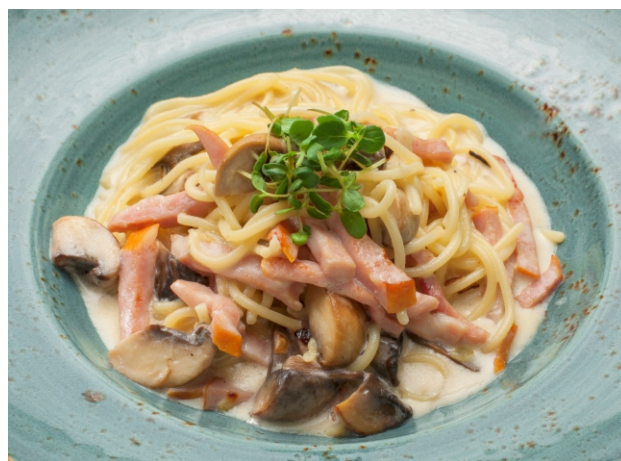
СПАГЕТТИ С ВЕТЧИНОЙ И ГРИБАМИ В СЛИВОЧНОМ СОУСЕ