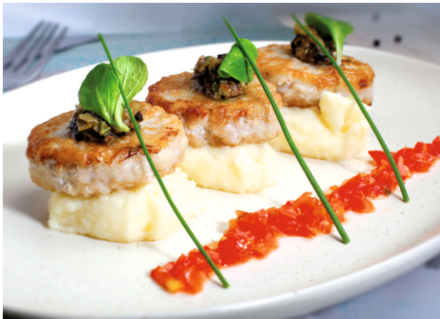
Котлетки из свинины с картофельным пюре и и томатной сальсой