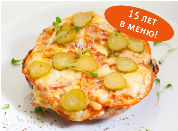
Мясо Ватикан с баклажаном и помидором