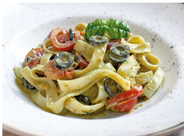
ТАЛЬЯТЕЛЛЕ С ТОМАТАМИ, БАЗИЛИКОМ В СОУСЕ ПЕСТО