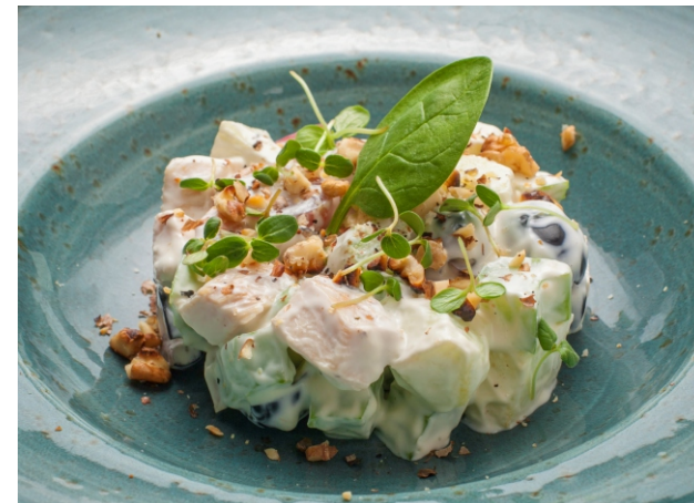
САЛАТ Вальдорф с курицей, виноградом и яблоками в сметанном соусе